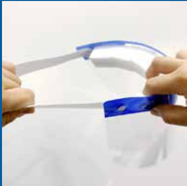
Remache de plástico con gran resistencia