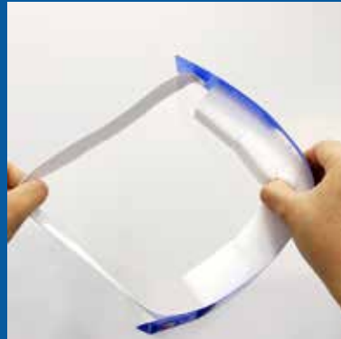
Banda elástica flexible adaptable cómodamente a todo tipo de tallas