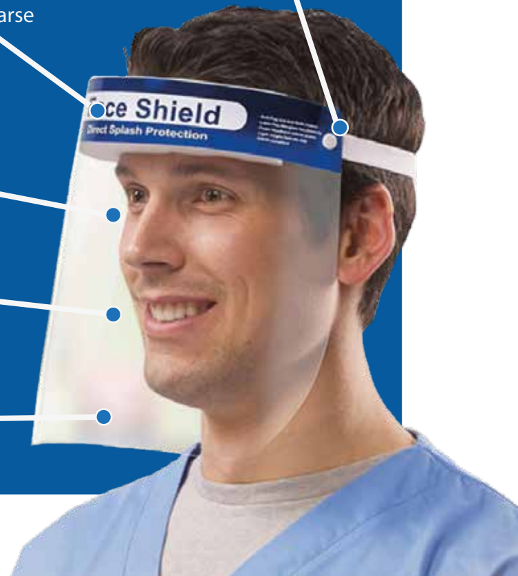
Completa protección de la cara